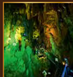
はらかな時が創りあげた 幻想美の世界

●あぶくま洞管理事務所 〒963-3601 福島県田村市滝根町菅谷字東釜山1 TEL/0247-78-2125 FAX/0247-78-2127 URL http://abukumado.com/