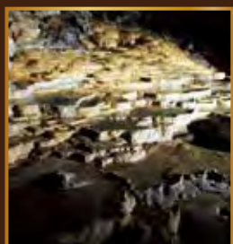
その「美しさ」は地球からのおくりもの

●飛騨大鍾乳洞観光株式会社 〒506-2256 岐阜県高山市丹生川町日面 1147 TEL/0577-79-2211 FAX/0577-79-2643 URL http://www.syonyudo.com