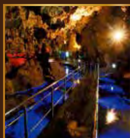
自然が創りだした神秘の世界

●龍泉洞事務所 〒027-0501 岩手県下閉伊郡岩泉町岩泉字神成1-1 TEL/0194-22-2566 FAX/0194-22-5005 URL http://www.iwate-ryusendo.jp/top.php