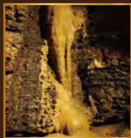
悠久の時間が刻んだ 驚異と神秘のタイムトンネル

●NPO法人西海市観光協会 七ツ釜鍾乳洞事務所 〒857-2222 長崎県西海市西海町中浦北郷2541-1 TEL/0959-33-2303 FAX/0959-33-2306 URL http://www.saikaicity.jp/