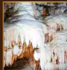
太古の謎を秘めた幻想の世界

●沖永良部昇竜洞観光社 〒891-9223 鹿児島県大島郡知名町大字住吉 1520 TEL・FAX/0997-93-4536