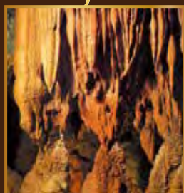
森林の地底にひろがる 3億年の自然のドラマ

●球磨村森林組合 〒869-6204 熊本県球磨郡球磨村大字神瀬甲1130 TEL/0966-34-0211 FAX/0966-34-0100 URL http://www.kyusendo.jp ●球泉洞 〒869-6205 熊本県球磨郡球磨村大字大瀬1122-1 TEL/0966-32-0080 FAX/0966-32-0100