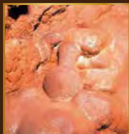
沈黙の宮殿に広がる 自然の芸術

●公益財団法人 龍河洞保存会 〒782-0005 高知県香美市土佐山田町逆川1424-ろ TEL/0887-53-2144 FAX/0887-53-2145 URL http://www.ryugadou.or.jp/